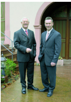
Herausgeber Paul-Heinz Haase Stefan Wolfert